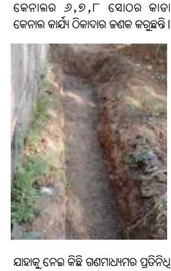
ଯାହାକୁ ନେଇ କିଛି ଗଣମାଧ୍ୟମର ପ୍ରତିନିଧି ଚାଡ଼ା ପାଇଁ ଠିକାଦାରଙ୍କ ନିକଟକୁ ଯାଇ

ମାହାଙ୍ଗା, ୨୧।୧:(ମନୁଜ)ମାହାଙ୍ଗା ବ୍ଲକ ର ଚାଷୀମାନଙ୍କର ସୁବିଧା ପାଇଁ କାଡ଼ା କେନାଲ ଖୋଳାଯାଇଥିଲା । ହେଲେ ପୂର୍ବସରକାର ଅମଳରେ ଏହାର ସଫେଇ କି ମରାମତି କାର୍ଯ୍ୟ କରା ନଥିବାରୁ କାଡ଼ା କେନାଲ ଗୁଡ଼ିକ ବାଟସଫେଇରେ ପରିଣତ ହୋଇଥିଲା । ଏ ସଂପର୍କରେ ବିଭିନ୍ନ ଗଣମାଧ୍ୟମରେ ଖବର ପ୍ରକାଶ ପାଇବା ପରେ ବର୍ତ୍ତମାନର ମାହାଙ୍ଗା ସ୍ୱାଧୀନ ବିଧାୟକ ଚାଷୀମାନଙ୍କ ସମସ୍ୟାକୁ ଦୃଷ୍ଟି ଦେଇ ଯୋଗ ଦେଇଥିବା କାଡ଼ା ପୁନଃସଫାୟନ ପାଇଁ ଯତ୍ନସହ ସୁରକ୍ଷା କରାଯାଇଛି । ଯାହା ଫଳରେ ମାହାଙ୍ଗା ବିଭିନ୍ନ ସ୍ଥାନରେ କାଡ଼ାକେନାଲ ଗୁଡ଼ିକର କାର୍ଯ୍ୟ ଚାଲିଛି । ଯାହା ଏକ ସ୍ୱାଗତ ଯୋଗ୍ୟ ପଦକ୍ଷେପ । କଟକ ଜିଲ୍ଲା ମାହାଙ୍ଗା ବ୍ଲକର ଗୌତପତା ଠାରେ ସାଲେପୁର କାଡ଼ା ବିଭାଗ ଓ ଗଜେଶ୍ୱର ପାଣି ପଂଚାୟତ