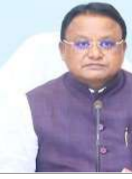
ନୂଆଦିଲ୍ଲୀ, ୨୫୫ (ନି.ପ୍ର.): ପରିସ୍ଥିତି ଉପରେ ଆଇନ ଶୁଖିଲାକୁ ସୁଦୂର କରିବାକୁ ରାଜ୍ୟ ସରକାର ଜଣକ ପରେ ଜଣେ ଆଇପିଏସ୍ ଅଧିକାରୀଙ୍କୁ ବଦଳି କରୁଛନ୍ତି।

ଭୁବନେଶ୍ୱର, ୨୫୫ (ନି.ପ୍ର.): ରାଜ୍ୟରେ ଆଇନ ଶୁଖିଲାକୁ ସୁଦୂର କରିବାକୁ ରାଜ୍ୟ ସରକାର ଜଣକ ପରେ ଜଣେ ଆଇପିଏସ୍ ଅଧିକାରୀଙ୍କୁ ବଦଳି କରୁଛନ୍ତି। ଆଇପିଏସ୍ ଦିନରେ ତିନି ଜଣ ଆଇପିଏସ୍ ବଦଳି ଏବଂ ନୂତନ ନିଯୁକ୍ତି କରିବାକୁ ରାଜ୍ୟ ଗୃହ ବିଭାଗ ଗତ ଶନିବାର, ୨୩ ମେ ୨୦୨୫ରେ ଆଇପିଏସ୍ ଉପରେ ଉପକ୍ରମ ଆଦେଶ ଜାରି କରିଛନ୍ତି। ଏହା ଗୋପନୀୟତା ଓ ସୁରକ୍ଷା ଦେଇ ଏହାକୁ ପ୍ରୋତ୍ସାହନ ଦେବାକୁ ସରକାର ଚାହୁଁଛନ୍ତି।