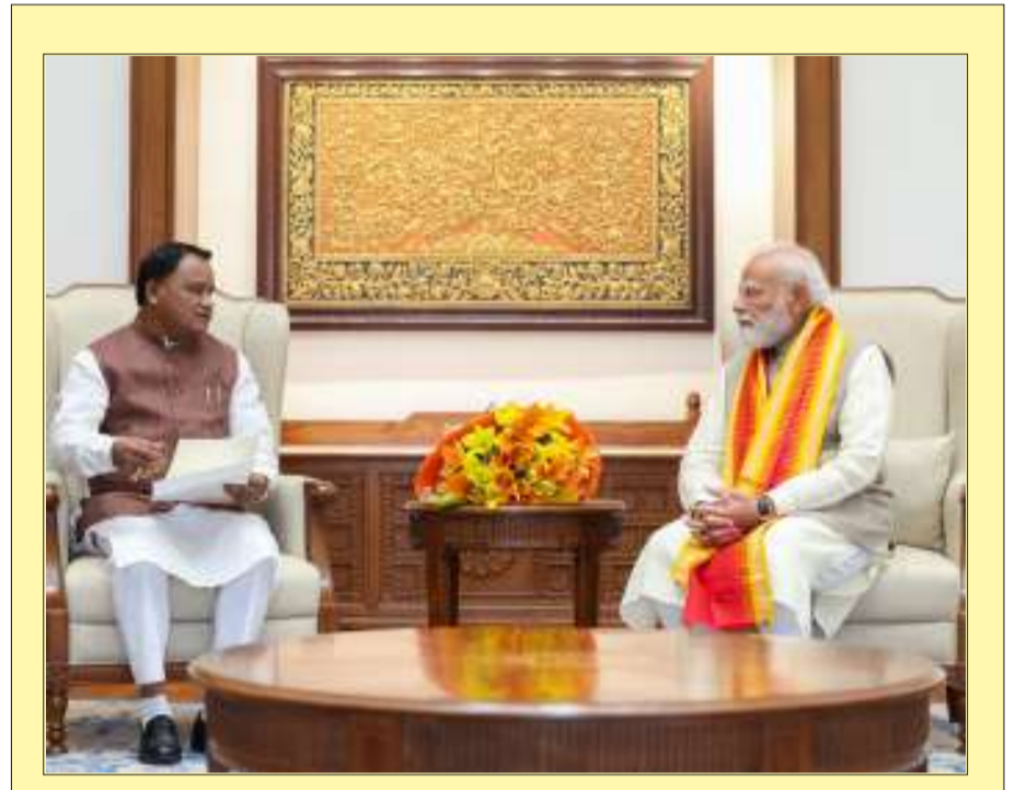
ମୁଖ୍ୟମନ୍ତ୍ରୀ ମନୋଜ ସିଂହା ଆଜି ନୂଆ ଦିଲ୍ଲୀରେ ପ୍ରଧାନମନ୍ତ୍ରୀ ନରେନ୍ଦ୍ର ମୋଦୀଙ୍କୁ ଭେଟି ସାକ୍ଷାତ ଆଲୋଚନା କରୁଛନ୍ତି।

ନୂଆଦିଲ୍ଲୀ, ୨୫୫ (ନି.ପ୍ର.): ଯୁବପିଢ଼ିଙ୍କ ମଧ୍ୟରେ ବହୁପରି ନିଶା ପ୍ରସ୍ତୁତ ହେଉଛି ବାଲି କେନ୍ଦ୍ର ସରକାର ନେତୃତ୍ୱରେ ଗଠିତ 'ପ୍ରେମାବାଲିନ' ଉପକ୍ରମ। ଏହା ଗୋପନୀୟତା ଓ ସୁରକ୍ଷା ଦେଇ ଏହାକୁ ପ୍ରୋତ୍ସାହନ ଦେବାକୁ ସରକାର ଚାହୁଁଛନ୍ତି। ଏହା ଗୋପନୀୟତା ଓ ସୁରକ୍ଷା ଦେଇ ଏହାକୁ ପ୍ରୋତ୍ସାହନ ଦେବାକୁ ସରକାର ଚାହୁଁଛନ୍ତି।