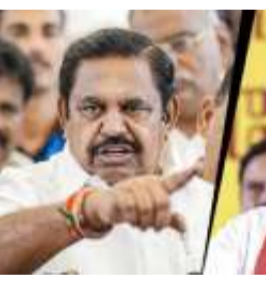
ନୂଆଦିଲ୍ଲୀ, ୨୫୫ (ନି.ପ୍ର.): ଚିତ୍ତକେରେ ମିଶିଲେ ଏଆଇଏସ୍‌ଏମ୍‌କେର ୩ ବିଧାୟକ।

ଚେନ୍ନାଇ, ୨୫୫ (ନି.ପ୍ର.): ଚିତ୍ତକେରେ ମିଶିଲେ ଏଆଇଏସ୍‌ଏମ୍‌କେର ୩ ବିଧାୟକ। ଚିତ୍ତକେରେ ମିଶିଲେ ଏଆଇଏସ୍‌ଏମ୍‌କେର ୩ ବିଧାୟକ।