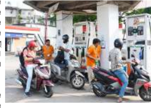
୧୧.୧୨ରେ ବିଶ୍ୱ ଅଣେଇ ତେଲ ଦର ୧୧୯ ଟଙ୍କା ୬୧ ପଇସା ଓ ତେଲ ୧୯୦ ଟଙ୍କା ୬୧ ପଇସା ଥିଲା।

ତେଲ ଦର ୫.୬୪% ହ୍ରାସ ପାଇଁ ବ୍ୟବସାୟ ଯୋଗ୍ୟ ହେବ। ତେଲ ଦର ୫.୬୪% ହ୍ରାସ ପାଇଁ ବ୍ୟବସାୟ ଯୋଗ୍ୟ ହେବ। ତେଲ ଦର ୫.୬୪% ହ୍ରାସ ପାଇଁ ବ୍ୟବସାୟ ଯୋଗ୍ୟ ହେବ। ତେଲ ଦର ୫.୬୪% ହ୍ରାସ ପାଇଁ ବ୍ୟବସାୟ ଯୋଗ୍ୟ ହେବ। ତେଲ ଦର ୫.୬୪% ହ୍ରାସ ପାଇଁ ବ୍ୟବସାୟ ଯୋଗ୍ୟ ହେବ। ତେଲ ଦର ୫.୬୪% ହ୍ରାସ ପାଇଁ ବ୍ୟବସାୟ ଯୋଗ୍ୟ ହେବ।