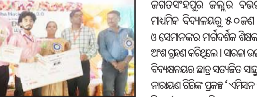
କରତସିଂହପୁର, ୬/୫ (ନି.ପ୍ର): କରତସିଂହପୁର ଜିଲ୍ଲାସଭାୟ ସ୍ୱାର୍ଥ ଓଡ଼ିଶା ହାକାଥନ ୩.୦ ଉତ୍ସବ ସ୍ଥାନୀୟ ସଦ୍‌ଭାବନା ସଭାଗୃହ ଠାରେ ଅନୁଷ୍ଠିତ ହୋଇଥିଲା । ଅଧିକାରୀଙ୍କୁ ନିର୍ଦ୍ଦେଶ ଦିଆଯାଇଛି । କେନ୍ଦ୍ରପଡ଼ା ଜିଲ୍ଲା କଣ୍ଠାକୂଳ ମହାସଙ୍ଗର ଅଧିବେଶନରେ ଅଧିକାରୀଙ୍କୁ ନିର୍ଦ୍ଦେଶ ଦିଆଯାଇଛି ।

କରତସିଂହପୁର, ୬/୫ (ନି.ପ୍ର): କରତସିଂହପୁର ଜିଲ୍ଲାସଭାୟ ସ୍ୱାର୍ଥ ଓଡ଼ିଶା ହାକାଥନ ୩.୦ ଉତ୍ସବ ସ୍ଥାନୀୟ ସଦ୍‌ଭାବନା ସଭାଗୃହ ଠାରେ ଅନୁଷ୍ଠିତ ହୋଇଥିଲା । ଅଧିକାରୀଙ୍କୁ ନିର୍ଦ୍ଦେଶ ଦିଆଯାଇଛି । କେନ୍ଦ୍ରପଡ଼ା ଜିଲ୍ଲା କଣ୍ଠାକୂଳ ମହାସଙ୍ଗର ଅଧିବେଶନରେ ଅଧିକାରୀଙ୍କୁ ନିର୍ଦ୍ଦେଶ ଦିଆଯାଇଛି । କେନ୍ଦ୍ରପଡ଼ା ଜିଲ୍ଲା କଣ୍ଠାକୂଳ ମହାସଙ୍ଗର ଅଧିବେଶନରେ ଅଧିକାରୀଙ୍କୁ ନିର୍ଦ୍ଦେଶ ଦିଆଯାଇଛି ।