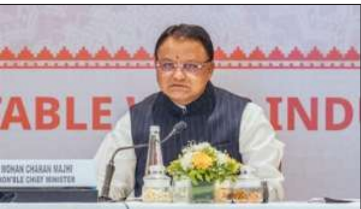
ମୁଖ୍ୟମନ୍ତ୍ରୀ କହିଛନ୍ତି, “ଆମେ ଗୁଜରାଟକୁ ଏକ ସ୍ୱସ୍ୱୟମ୍ଭବ ନେଇ ଆସିଛୁ । ଭାରତର ଶିଳ୍ପ ଅଭିବୃଦ୍ଧିର ପରବର୍ତ୍ତୀ ଅଧ୍ୟାୟ ପାଇଁ ଓଡ଼ିଶା ସମ୍ପୂର୍ଣ୍ଣ ଭାବେ ପ୍ରସ୍ତୁତ । ଆମେ ଶିଳ୍ପକରତକୁ ଓଡ଼ିଶାରେ ନିବେଶ କରିବାକୁ ଆମନ୍ତ୍ରିତ କରୁଛୁ, ଏବଂ ମିଳିତ ଅଭିବୃଦ୍ଧି ମାଧ୍ୟମରେ ଦେଶର ସମୃଦ୍ଧିରେ ସୁଯୋଗ ଓ ନୀତିଗତ ସହାୟତା ଦିଅନ୍ତୁ ।”

ଅହମ୍ମଦାବାଦ, (ଗୁଜରାଟ), ୬/୫: “ଗୁଜରାଟ ଭାରତର ପଶ୍ଚିମ ଭାଗକୁ ସମୃଦ୍ଧ କରିଛି । ବର୍ତ୍ତମାନ ଭାରତର ପୂର୍ବ ଭାଗକୁ ସମୃଦ୍ଧ କରିବା ପାଇଁ ଓଡ଼ିଶା ସମ୍ପୂର୍ଣ୍ଣ ପ୍ରସ୍ତୁତ । ତୁଟ ଅଭିବୃଦ୍ଧି ଏବଂ ରାଜନୈତିକ ଯୋଜନା ସହିତ ଓଡ଼ିଶା ବର୍ତ୍ତମାନ ଶିଳ୍ପକରତ ପାଇଁ ବ୍ୟାପକ ସୁଯୋଗ ସୃଷ୍ଟି କରିପାରିଛି । ଏହା ସହିତ ପ୍ରତିଯୋଗିତାମୂଳକ ପରିବେଶରେ ନିବେଶକ ମାନଙ୍କୁ ଆକର୍ଷଣ କରିବାକୁ ସୁବିଧାଜନକ ସ୍ଥିତି ମଧ୍ୟ ପ୍ରଦାନ କରୁଛି ।” ଆଜି ଅହମ୍ମଦାବାଦରେ ଆୟୋଜିତ ‘ଓଡ଼ିଶା ନିବେଶକ ସମ୍ମିଳନୀ ରୋଡ୍-ଶୋ’ରେ ନିଜର ଅଭିଭାଷଣ ରଖି ମୁଖ୍ୟମନ୍ତ୍ରୀ ମୋହନ ଚରଣ ମାଝି ଏହି ବୃତ୍ତ, ଦୂରଦୃଷ୍ଟିସମ୍ପନ୍ନ ବାଣୀ ଦେଇଛନ୍ତି । ‘ପୂର୍ବୋଦ୍‌ୟ’ ପରିକଳ୍ପନାରେ ଆଗାମୀ ଦିନରେ ଓଡ଼ିଶାକୁ ଦେଶର ଶିଳ୍ପ ଅଭିବୃଦ୍ଧିର କେନ୍ଦ୍ରଭୂମି ଭାବେ ଗଢ଼ିତୋଳିବା ପାଇଁ ଏହା ଏକ ଗୁରୁତ୍ୱପୂର୍ଣ୍ଣ ପଦକ୍ଷେପ ବୋଲି ମୁଖ୍ୟମନ୍ତ୍ରୀ କହିଛନ୍ତି ।