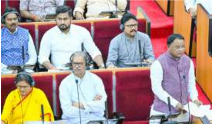
ଦଳର ମାନ୍ୟତା ସଦସ୍ୟ ସଦସ୍ୟାମାନେ ଅଛନ୍ତି । ସେମାନେ ପଞ୍ଚାୟତିରାଜ ବ୍ୟବସ୍ଥାରେ ୫୦ ପ୍ରତିଶତ ମହିଳା ସଂରକ୍ଷଣକୁ ନେଇ ବହୁବିଧା ଉପସ୍ଥାପନା କରୁଛନ୍ତି, ଆଜି ବି ଆଲୋଚନା ସମୟରେ ସେମାନେ ଉପସ୍ଥାପନା କରୁଛନ୍ତି । କିନ୍ତୁ, ଯେତେବେଳେ ବିଧାନସଭା ଓ ଲୋକସଭା ପାଇଁ ଆରକ୍ଷଣ କଥା ଉଠୁଛି ସେମାନେ କାହିଁକି ମହିଳା ବିରୋଧୀ ଆଚରଣ କରୁଛନ୍ତି ? ଏହାର ଉତ୍ତର ହେଉଛି ଏଠାରେ ବସିଥିବା ମାନ୍ୟବର ସଦସ୍ୟ ଓ ସଦସ୍ୟା କିମ୍ବା ତାଙ୍କ ଦଳର ଆଗାଧିକାରୀ ନେତାମାନେ ତ ଆଉ ସରପଞ୍ଚ କି କିନ୍ତୁ ପରିଷଦ ନିର୍ଦ୍ଦେଶ ଲାଭିବେ ନାହିଁ, ତେଣୁ ତାଙ୍କର ପଞ୍ଚାୟତ ନିର୍ଦ୍ଦେଶରେ