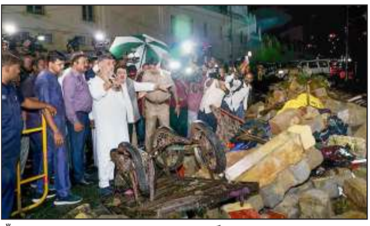
ହିଁ ଭୁସ୍ଥିତି ପଡ଼ିବାରୁ ଏହା ତଳେ ଲୋକମାନେ ପରିବର୍ତ୍ତନ କରିବା ସହ ମୃତକଙ୍କ ପରିବାର ଚାପି ହୋଇ ଯାଇଥିଲେ । ଉଦ୍ଧାରକାରୀ ଦଳ ତୁରନ୍ତ ଘଟଣା ସ୍ଥଳରେ ପହଞ୍ଚି ଅପରୋଧନ ଆରମ୍ଭ କରିଥିଲେ । ହେଲେ ସେତେବେଳକୁ ୮ ଜଣଙ୍କ ମୃତ୍ୟୁ ହୋଇ ସାରିଥିଲା । କର୍ଣ୍ଣାଟକୀୟ ମୁଖ୍ୟମନ୍ତ୍ରୀ ସିଦ୍ଧାଧାର ମୋଦୀ ଘଟଣା ସ୍ଥଳ

ବେଙ୍ଗାଳୁରୁ, ୩୦/୪: ଭାରତର ପୂର୍ବ ଠାରୁ ଉତ୍ତର ପ୍ରାନ୍ତରେ ପ୍ରବଳ ଗ୍ରୀଷ୍ମ ପ୍ରବାହ ଜାରି ରହିଛି । ହେଲେ ଦେଶର ଦକ୍ଷିଣ ପ୍ରାନ୍ତ ବିଶେଷ କରି କର୍ଣ୍ଣାଟକର ବେଙ୍ଗାଳୁରୁରେ ପ୍ରବଳ ବର୍ଷା ଓ ପବନ ସାଂଘାତିକ ସ୍ଥିତି ସୃଷ୍ଟି କରିଛି । ବୁଧବାର ଅପରାହ୍ଣରୁ ଆରମ୍ଭ ହୋଇଥିବା ଏତଦର୍ଥ ବ୍ୟାପକ କ୍ଷୟକ୍ଷତି କରିଛି । ଏଥିରେ ୯ ଜଣ ପ୍ରାଣ ହରାଇଥିବା ବେଳେ ୧୦ରୁ ଅଧିକ ଆହତ ହୋଇଛନ୍ତି । ଏତଦର୍ଥ ଯୋଗୁ ବେଙ୍ଗାଳୁରୁ ସ୍ଥିତ ବୋହରିଙ୍ଗ ଓ ଲୋଡା କୁରକନ ମେଡିକାଲ କଲେଜ ଓ ରିସର୍ଚ୍ଚ ଇନଷ୍ଟିଚ୍ୟୁଟ ନିକଟରେ ଗୋଟିଏ ବିରାଟକାୟ ପାଚେରୀ ଭୁସ୍ଥିତି ପଡ଼ିଛି । ଏଥିରେ ୭ ଜଣ ପ୍ରାଣ ହରାଇଥିବା ବେଳେ ୭ ଜଣ ଆହତ ହୋଇଛନ୍ତି । ହସିଗାଲ ପରିସର ନିକଟସ୍ଥ ଗୋଟିଏ ବିଲଡିଂର ପାଚେରୀ ଭୁସ୍ଥିତି ପଡ଼ିବାରୁ ଏତେ ବଡ଼ ଘଟଣା ଘଟିଛି । ବର୍ଷାରୁ ବର୍ଷା ପାଇଁ ରାଷ୍ଟ୍ରାକତ ବେପାରୀ ଓ ପଥଚାରୀମାନେ ପାଚେରୀ ନିକଟରେ ଆଶ୍ରୟ ନେଇଥିଲେ । ହେଲେ ସେହି ପାଚେରୀଟି