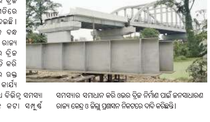
ସମସ୍ୟାର ସମାଧାନ କରି ଓଭର ବ୍ରିଜ୍ ନିର୍ମାଣ ପାଇଁ ଜନସାଧାରଣ ରାଜ୍ୟ କେନ୍ଦ୍ର ଓ ଜିଲ୍ଲା ପ୍ରଶାସନ ନିକଟରେ ଦାବି କରିଛନ୍ତି ।