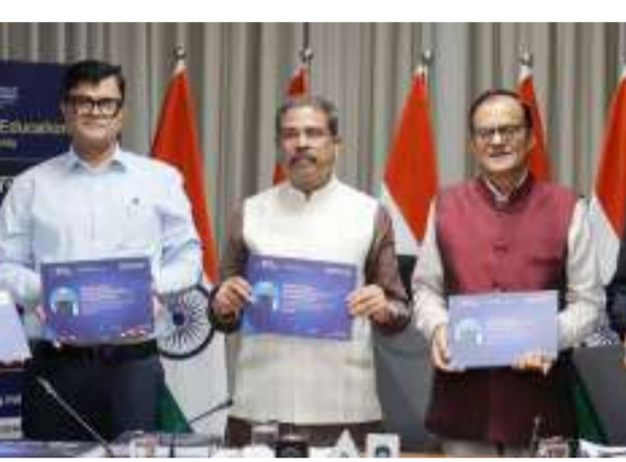
ପାଇଁ ବିଶ୍ୱର ଅନେକ ଆର୍ଥିକ ପ୍ରତିଷ୍ଠାନ, ଆନ୍ତର୍ଜାତୀୟ କମ୍ପାନୀ ଏବଂ ରୁଚିକାବାମାନଙ୍କୁ ଆମନ୍ତ୍ରଣ କରାଯାଇଛି । ଏଠାରେ ଆଲୋଚନା ସହ ବ୍ୟବସାୟିକ ବୈଠକ ମଧ୍ୟ ଅନୁଷ୍ଠିତ ହେବ ।

କରାଯାଇ ୧୨୦ଟି ପ୍ରତିଭାବାନ ନୂତନ ଷ୍ଟାର୍ଟଅପକୁ ଚୟନ କରାଯାଇଛି । ଏହି ଷ୍ଟାର୍ଟଅପଗୁଡ଼ିକ ୧୩ଟି ପ୍ରାଥମିକତା କ୍ଷେତ୍ର ଉପରେ କାର୍ଯ୍ୟ କରୁଛନ୍ତି ଏବଂ ଦେଶର ୨୦ରୁ ଅଧିକ ପ୍ରମୁଖ ଶିକ୍ଷାନୁଷ୍ଠାନ ସହିତ ଭାଗିଦାର ହୋଇଛନ୍ତି । ଜୁନ ୧୪ ରୁ ୧୬ ପର୍ଯ୍ୟନ୍ତ ଚାଲିବାକୁ ଥିବା ଏହି କାର୍ଯ୍ୟକ୍ରମରେ ଅଂଶଗ୍ରହଣ କରିବା