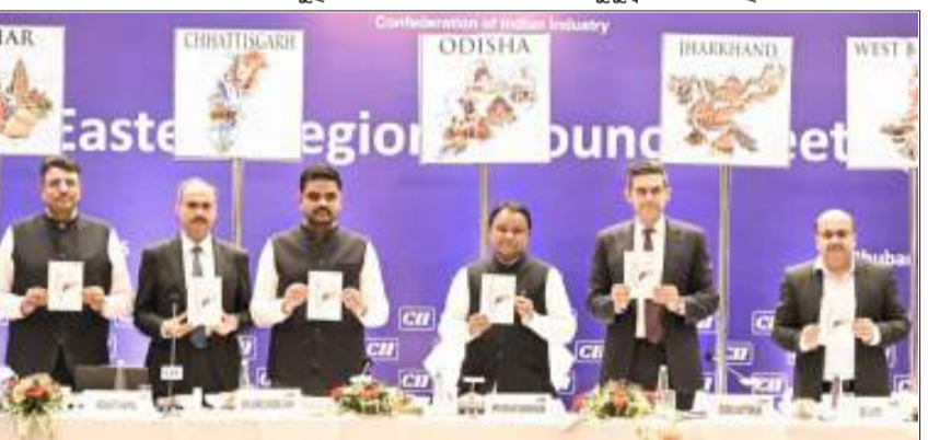
ସୀମାବର୍ତ୍ତୀ-ପଛୁଆ ଜିଲ୍ଲା ଉପକୂଳ ହେବେ

କହିଛନ୍ତି ବୋଲି ମୁଖ୍ୟମନ୍ତ୍ରୀ କହିଥିଲେ । କାର୍ଯ୍ୟକ୍ରମକୁ ସମ୍ପୂର୍ଣ୍ଣ କରି ଶିଳ୍ପ ମନ୍ତ୍ରୀ ସମ୍ପଦ ବହୁ ସାହି ରାଜ୍ୟର ସୁବର୍ଣ୍ଣ ଓ ଦକ୍ଷତା ବିକାଶ ଉପରେ ଗୁରୁତ୍ୱରୋପ କରିଥିଲେ । ଶିଳ୍ପ ଜଗତର