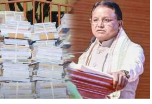
ପିଲାଙ୍କୁ ସଂଶୋଧିତ ତଥ୍ୟ ସମ୍ବଳିତ ପୁସ୍ତକ ବା ବିଭିନ୍ନ ପ୍ରକାରର ପେକ୍ ଓ ପ୍ରିଣ୍ଟିଂ କରାଯାଇ ବିତରଣ ଦିଆଯିବ । ଏହି ସଂଶୋଧିତ

ପାଠ୍ୟପୁସ୍ତକ ତ୍ରୁଟି ମାମଲାର ମୁଖ୍ୟମନ୍ତ୍ରୀଙ୍କ କଡ଼ା କାର୍ଯ୍ୟାନୁଷ୍ଠାନ ୬ଜଣଙ୍କ ବିଭିନ୍ନ କୋର୍ଟରେ କାର୍ଯ୍ୟାନୁଷ୍ଠାନ