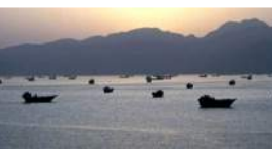
ନିୟୋଜିତ ରହିଥିବା ସମୟରେ ଭରାନ ପକ୍ଷରୁ ଏହି ଆକ୍ରମଣ ହୋଇଛି । ଓମାନ ଉପକୂଳରେ ଏକ ମାଲକାହା ଜାହାଜ ଉପରେ ଆକ୍ରମଣ ପରେ, କାଟିଂସଂଘର ସାମୁଦ୍ରିକ ସଂଗ୍ରା, ଅନ୍ତର୍ଜାତୀୟ ସାମୁଦ୍ରିକ ସଂଗଠନ (ଆଇଏମ୍ଏଫ୍) ଉଦ୍ଧାର କାର୍ଯ୍ୟକୁ ସୁରକ୍ଷିତ ରଖିଛି । ଆଇଏମ୍ଏଫ୍ ନିଷ୍ଠା ପାରସ୍ତ ଉପସାଧାରଣରେ ଫସି ରହିଥିବା ଜାହାଜରେ ପ୍ରାୟ ୧୧,୦୦୦ ନାବିକଙ୍କ ସୁରକ୍ଷା ଉପରେ ଗାମ୍ଭୀର ପ୍ରଶ୍ନ ଉଠାଇଛି ।

କାଟିଂସଂଘର ଉଦ୍ଧାର କାର୍ଯ୍ୟରେ ଗତ କିଛି ଦିନ ହେଲା କାଟିଂସଂଘ ଓମାନ ଓ ଅନ୍ୟ କେତେକ ସହଯୋଗୀ ଦେଶମାନଙ୍କ ସାହାଯ୍ୟରେ ପାରସ୍ତ ଉପସାଧାରଣରେ ଫସି ରହିଥିବା ଜାହାଜକୁ ସୁରକ୍ଷିତ ଭାବେ ବାହାର କରିବାକୁ ଅପରାଧରେ ଆରମ୍ଭ କରିଥିଲା । ଯୁଦ୍ଧ ଓ ସୁରକ୍ଷା କଟକଣା ଯୋଗୁଁ ଦୀର୍ଘ ଦିନ ଧରି ଫସି ରହିଥିବା ଜାହାଜଗୁଡ଼ିକୁ ହର୍ମୁଜ ପ୍ରାଣାଳୀ ପାର କରିବାରେ ସାହାଯ୍ୟ କରିବା ଏହି ମିଶନର ଲକ୍ଷ୍ୟ ଥିଲା । କିନ୍ତୁ ଓମାନ ଉପକୂଳରେ ସିଙ୍ଗାପୁର ପତାକା ବନ୍ଦନ କରୁଥିବା ମାଲକାହା ଜାହାଜ 'ଏକର ଲଭଲି' ଉପରେ ଗୁରୁତ୍ୱର ଆକ୍ରମଣ ପରେ ଆଇଏମ୍ଏଫ୍ ସହାୟ ଉଦ୍ଧାର କାର୍ଯ୍ୟ ବନ୍ଦ ରଖିଛି । ଏହି ଆକ୍ରମଣରେ କେଶି ସିନା କିଲିକ ମୃତ୍ୟୁ ହୋଇ ନଥିଲେ ମଧ୍ୟ ଜାହାଜ